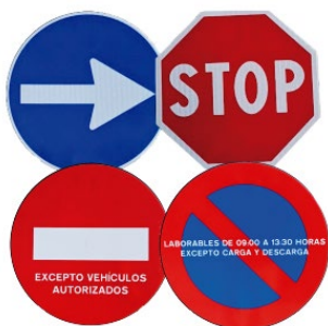
Fondo blanco para señalización fija