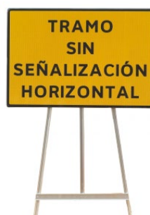
Modelos con textos personalizados