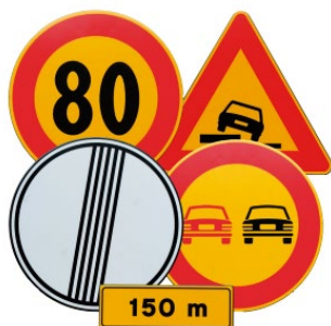
Fondo amarillo para obras móviles