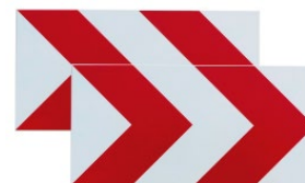
Modelos TB y otras señales específicas