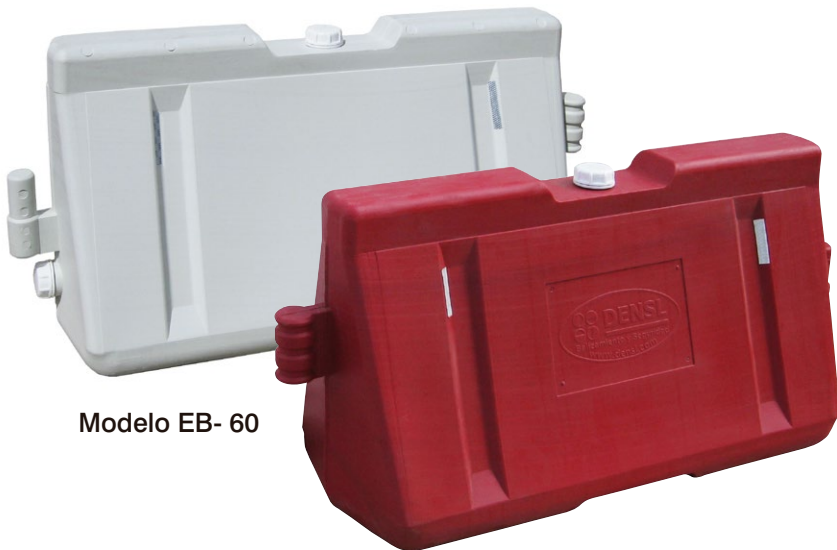
Modelo EB- 60